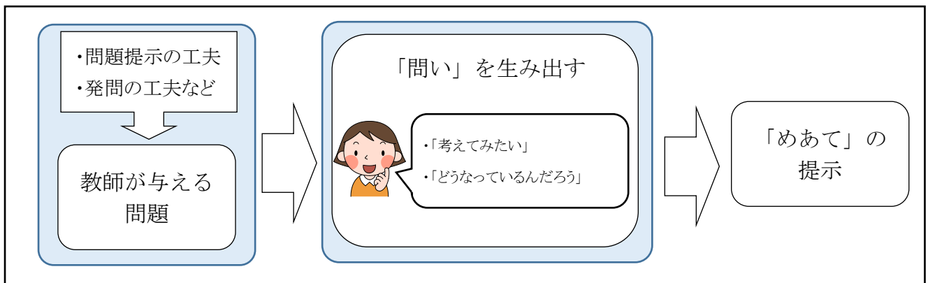
図3 問題から「めあて」

「つかむ段階」で「めあて」を提示する際、このような児童の声が聞こえてきますか？「めあて」を教師から一方的に与えても、「主体的な学び」の実現は難しいのかもしれませんが。下の図2のように、まずは、問題の提示の工夫をし、児童に、「なぜだろう？」「どっちが～だろう？」と「問い」を生み出させることが必要です。その上で、「解いてみたい！」「考えてみたい！」という児童の意欲を喚起するような発問を行い、その声を基に本時の学習の「めあて」を児童と共に確認しましょう。