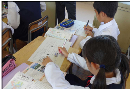
生徒の意思決定の様子