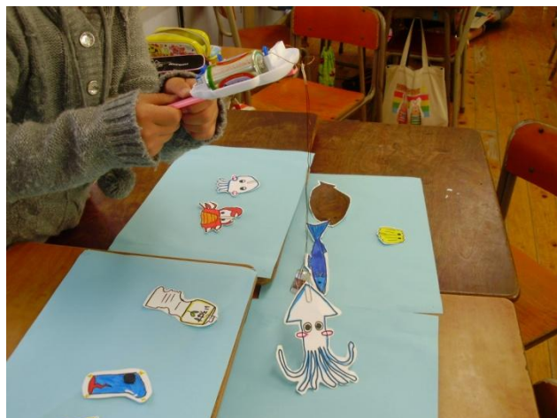
より楽しくする工夫 【釣り上げる魚などに，磁石をつけておく】 …電池の向きを変えない限り釣り上げられなくなる。 【強力な電磁石を作る】 …より大きな（重い）魚も釣り上げることができるようになる。