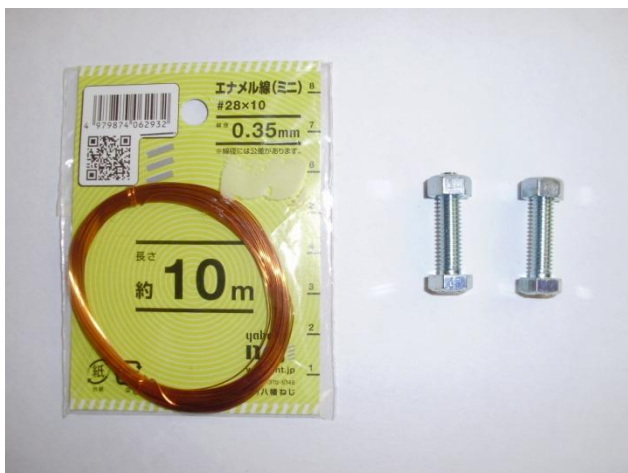
準備するもの：エナメル線，ボルト，ナット