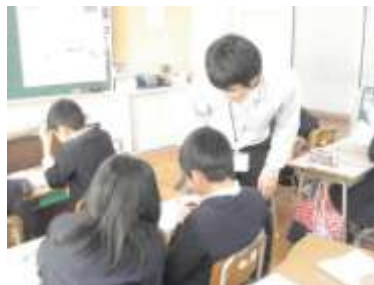
「ペアで説明している様子」