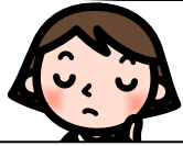
フロアからの質問

使い捨ての割りばしでなく、マイはしを使おうという運動がありますが、その点についてはどうですか。間伐材の利用については、何も、ゴミになる割りばしでなくてもいいと思います。その点については、どうですか。