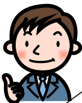
ゲストティーチャー

私は建築の仕事をしていますが、日本の杉やヒノキは高く、外国産を使うことが多いです。日本の人件費は高く、森林を継続して守っていく仕事をする人が少ないのです。しかし、これではいけない、世界の木を使わず、地元の木で建てようという推進運動も始まっています。早く育つ木の研究も進められています。ところで、マイはしを持っている人は何人ですか。マイはし以外にも、こまめに節電したら自然を守ることになります。みなさんが今回考えて行動したことが、地球を守ろうとする気持ちにつながります。積み重ねていってください。