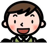
コーディネーター

森林の現状はどうでしょうか。割りばしから見える世界について、「森」グループさん、お願いします。