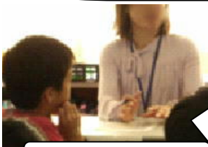
ゲストティーチャー

残すことに心を痛め、食べられることに感謝してほしい と思うので、 食べる分だけ作ったり、残飯0に取り組んだり していることがうれしいです。 天然に存在しない化学合成の添加物は、体に悪影響を及ぼします。 みなさんが言うように 表示をよく見て買う ことが必要です。環境を守るためには、 むだに買わない、作らない、残さない、食材は使い切る意識 が必要ですね。