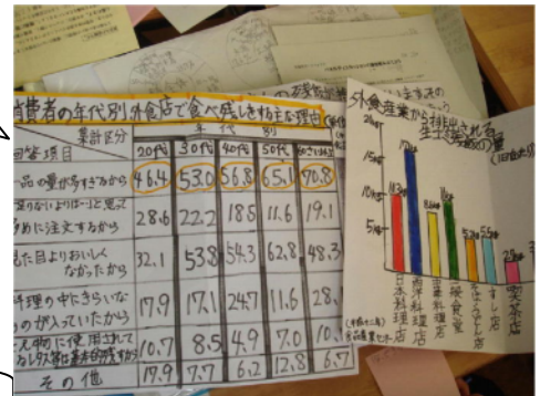
フロアにいるメンバーからの補足

ぼくたちのグループでは、 生ゴミをリサイクルするコンポスト に挑戦する他、 外食で残す割合が多い ことにも注目し、その原因を探って統計グラフにまとめました。グラフからも、 量が多くて残している人が多い ことがわかります。このことは まつりで地域の人に発信し、残飯を減らす ことにつなげます。