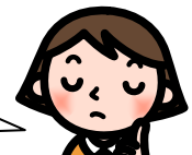
フロアからの質問

ぜい沢な生活に改善が求められていますね。 各パネリストに質問や意見はありませんか。