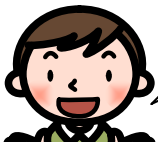
コーディネーター

ぜい沢な生活に改善が求められていますね。 各パネリストに質問や意見はありませんか。